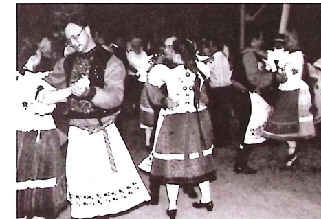
Ropják a táncot kivilágos kivrirdig...

körbe 9 nyoszolyólány. Az ágyon legalább 7 párna díszlett, Kaliforniából, Pennsylvániából, sőt Magyarországról is jött egy. A vőfélyek, gondolom, nem ismervén a huncut népszokást, békében hagyták a párnákat, így az ágy tökéletesen rendezett maradt. Utólag persze kiderült, hogy jólszolgált az új párna(k).