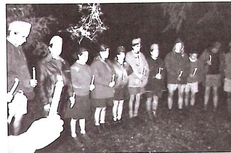
Magyar őrsvezetők esküteletétele az ausztrál őrserdőben

A tábor forgatókönyvét a „Pál utcai fiúk” című könyvre építettük fel. Ezért a három őrs a Boka, Csónakos és Nemecsek nevet kapta. Az őrsöket a helyszínen állítottuk össze, hogy a Sydney-ek együtt lehessenek a Melbourne-iekkel. Összesen 15-en voltunk, kilencen Sydney-ből, hatan Melbourne-ből, valamint 8 vezető. A tíz nap után csodálatos élményekkel és tudásanyaggal gyarapodtunk.