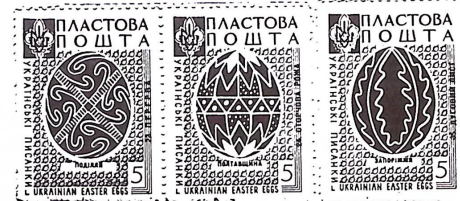
Ukrán cserkészek húsvéti bélyegei

A németországi magyarok létszámát 120 ezerre becsülik, ebből 100 ezer német honosított (német állampolgár). Közülük 25 ezer volt vajdasági vendégmunkás, 30 ezer erdélyi, 5 ezer felvidéki, a többi anyaországi magyar. 11 külföldi magyar cscs. létezik 9 városban. A Magyar Gimnázium 300 diákkal Kastl-ben működik. Közéleben van a 10 hektáros, gyönyörű Hárshegy-Cserkészpark.