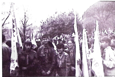
Az RMCSSZ 5 éves jubileumán, Szárhegyen...