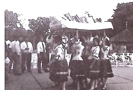
A nyoszolyólányok viszik a menyasszony ágyát

Gondolom, a lagzi legszínesebb jelenetei közé tartozott a „menyasszonyi ágyvitel” Magyarország egyes vidékein, a Palócföldön is az volt a szokás, hogy a nagy