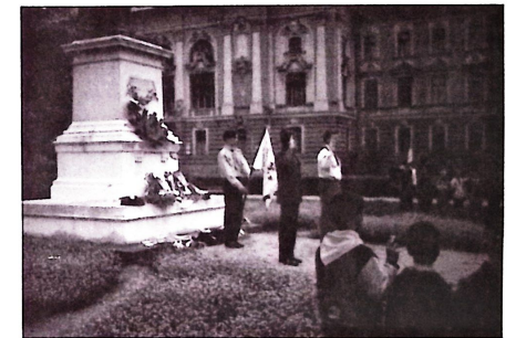
Fogadalomtétel Tompa Mihály szobra előtt.